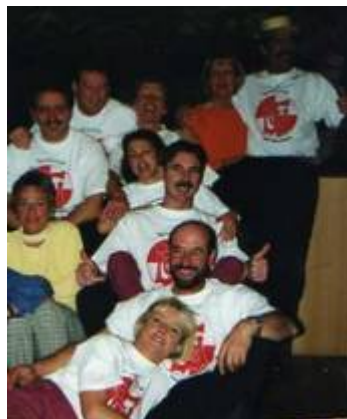
die „Olympioniken“ des TCW

2001 Der TCW beteiligte sich an der „nährischen Olympiade“ des WCV.