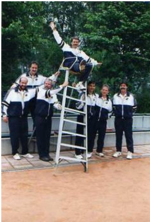
Aufstieg von Kreis A in Bezirk B