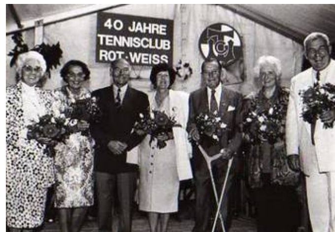
Ehrung der Gründungsmitglieder

1993 erstmals findet ein Deutsches Jugendranglisten Turnier der Toyota-Cup auf der Anlage des TCW statt. 89 Jungen und Mädchen im Alter von 10-14 Jahren aus ganz Deutschland kämpften und Pokale und Punkte für die Deutsche Rangliste. Ins Leben gerufen hatte dieses Turnier das Ehepaar Werner. Nach 5 Jahren gab das Ehepaar Werner die Turnierleitung an das Ehepaar Zschieschang und B. Weisgerber ab, welche ab diesem Zeitpunkt bis heute verantwortlich den Toyota-Cup leiten.